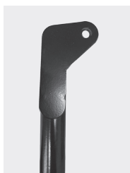
Отверстие в боковой опоре