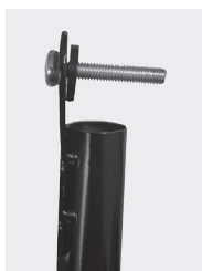
Продеть болт в отверстие и насадить шайбу