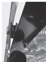
Продеть болт в отверстие кровати